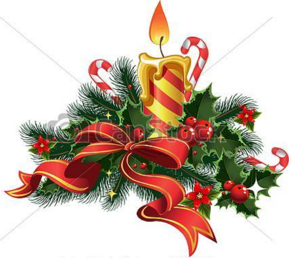
© Can Stock Photo - csp10737026